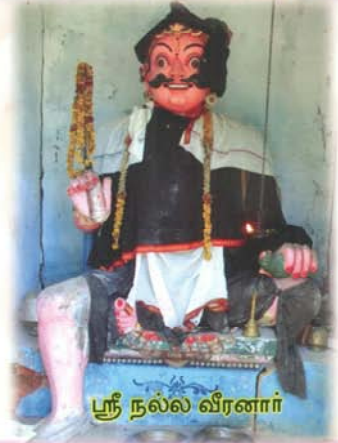
ஸ்ரீ நல்ல வீரனார்

இந்த திருப்பணிகளுக்கான நிதி உதவியை ETM TRUST என்ற பெயரில் காசோலை / DD / RTGS / NEFT மூலமாக அனுப்பும்படி வேண்டுகிறோம்.