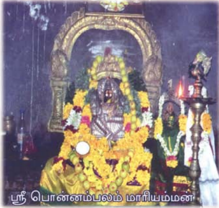
ஸ்ரீ பொன்னம்பலம் மாரியம்மன்