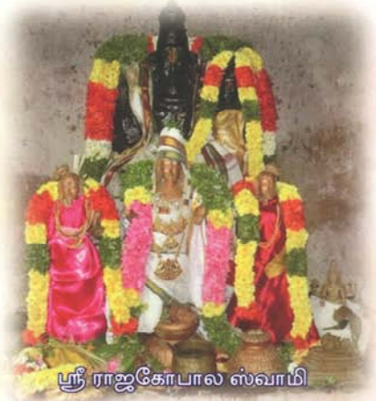
ஸ்ரீ ராஜகோபால ஸ்வாமி