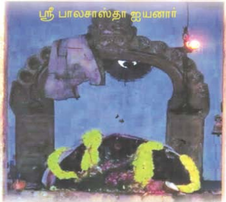
ஸ்ரீ பாலசாஸ்தா ஐயனார்

ETM TRUST (Regd No. 51/2014) DAFFODILS, THIRD FLOOR, No: 45, BAJANA KOIL STREET, CHOLAI MEDU, CHENNAI - 600 094.